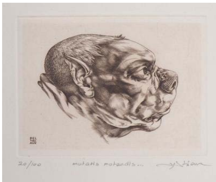
Mutatis mutandis (gravure au burin sur cuivre, 9x12 cm)

Des portraits et nus académiques aux grotesques, des paysages cévenols aux scènes fantastiques, l'exposition MUTATIS MUTANDIS propose, en une centaine d'œuvres, un parcours dans l'univers dessiné de Luc Peltriaux.